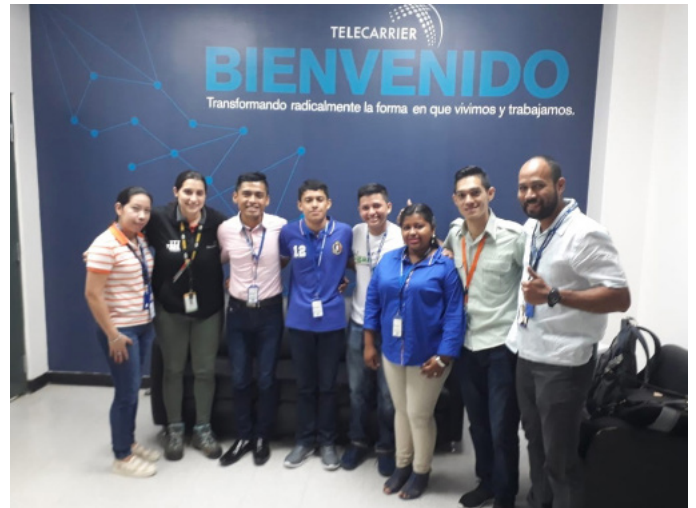
Estudiantes del PIP de Nicaragua en la Empresa TELECARRIER, Ciudad del Saber, Panamá.