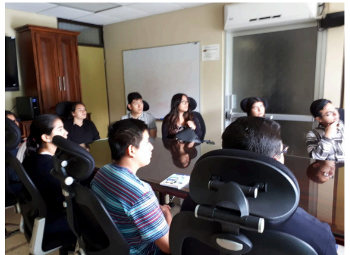
Estudiantes del PIP de Guatemala y el Salvador con Vicerector de Investigación y Director de la Escuela de Administración del TEC, Costa Rica.