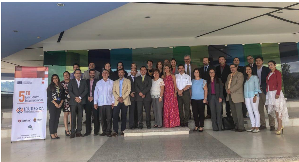
Quinta Reunión Internacional del Consorcio IRUDESCA, Tegucigalpa, Honduras.