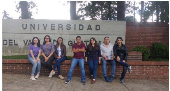
Estudiantes del PIP de la UNAH de Honduras en la UVG de Guatemala.