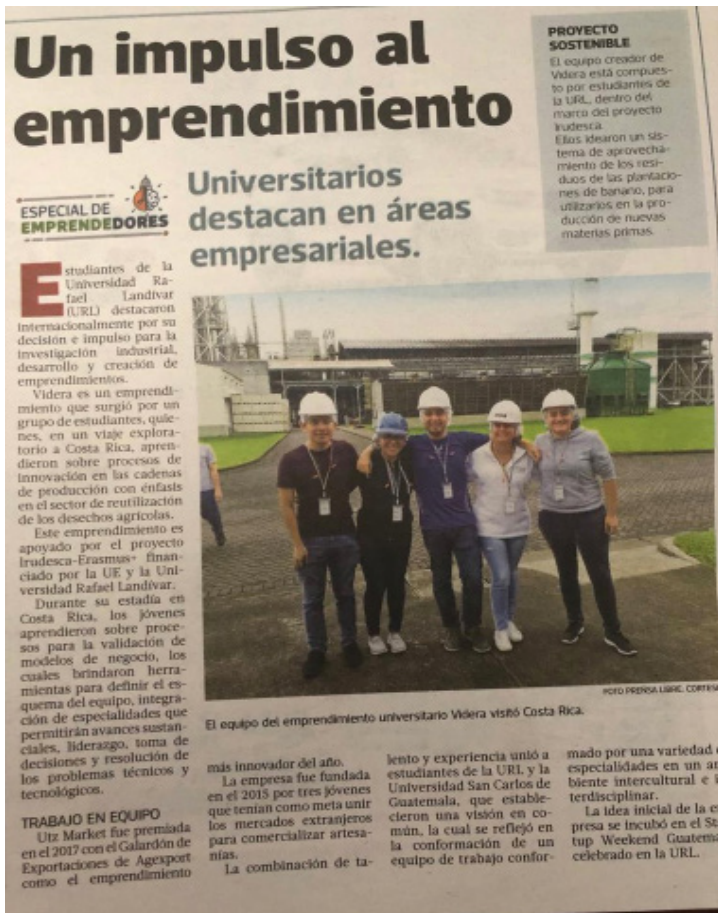
Publicación Prensa Libre de Guatemala, Proyecto IRUDESCA.

Al momento de elaborar este boletín está pendiente la evaluación de dichas prácticas. Cabe señalar que debido a las condiciones de inestabilidad política y conflicto en Nicaragua, las Universidades de dicho país no recibieron estudiantes de otros países, aunque sus estudiantes si pudieron realizar sus prácticas en empresas panameñas bajo la tutoría de la USMA y la Universidad de Panamá (UP).