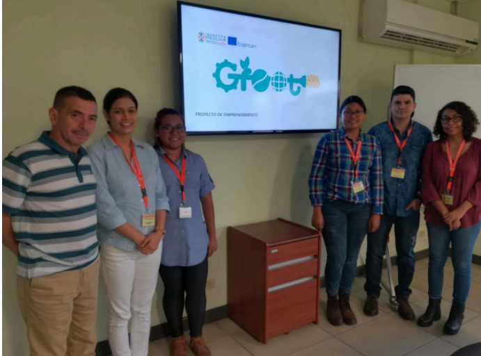
Estudiantes del PIP de la UCA de El Salvador en la EARTH de Costa Rica.