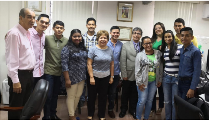
Estudiantes del PIP de Nicaragua en Panamá.