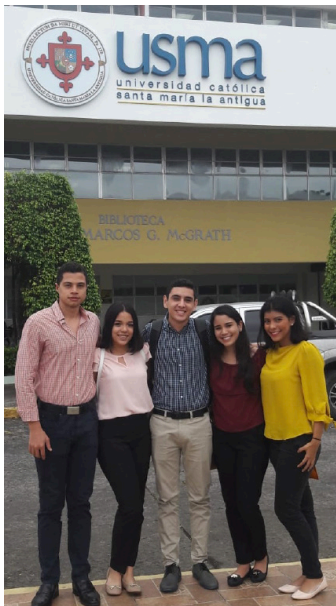
Estudiantes del PIP de la UNAN de Managua, Nicaragua, en la USMA Panamá.