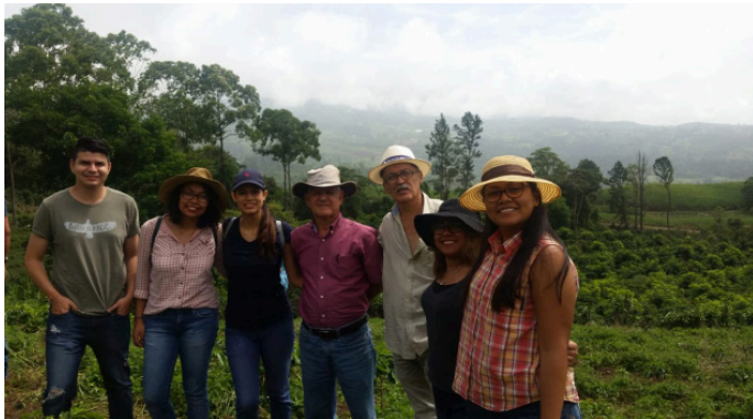
Estudiantes de la UCA de El Salvador en Finca Cafetalera Sostenible de Costa Rica.