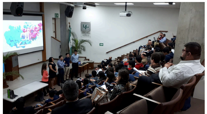
Estudiantes del PIP de UNITEC de Honduras, presentando sus experiencias en Universidad del Valle de Guatemala.

El “Programa Internacional de Prácticas en Empresas” permitió que 60 estudiantes de los proyectos de Emprendimiento Empresarial (5 estudiantes por Universidad) seleccionados por el Comité Académico (integrado por socios No participantes en el acompañamiento a los PEE de las universidades, para garantizar la transparencia en la selección), realizaran sus prácticas durante tres semanas en empresas de otros países centroamericanos, los cuales fueron tutorizados por las Universidades receptoras del Consorcio. Cada Universidad realizó la selección de empresas y la agenda de actividades del PIP que recibió. Se elaboró una Guía para las Prácticas, que incorpora los modelos de acuerdo entre los estudiantes y las Universidades receptoras, así como otros modelos de acuerdo y soportes para facilitar la actividad. Los distintos períodos de prácticas se desarrollaron durante junio a septiembre de 2018, en diferentes tiempos según la disposición de cada Universidad