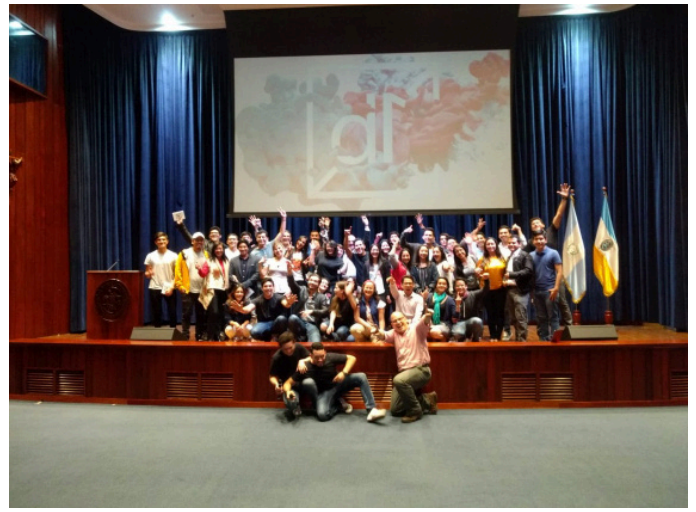
Satisfechos por culminación del Day One event by IRUDESCA UNITEC en la URL de Guatemala.