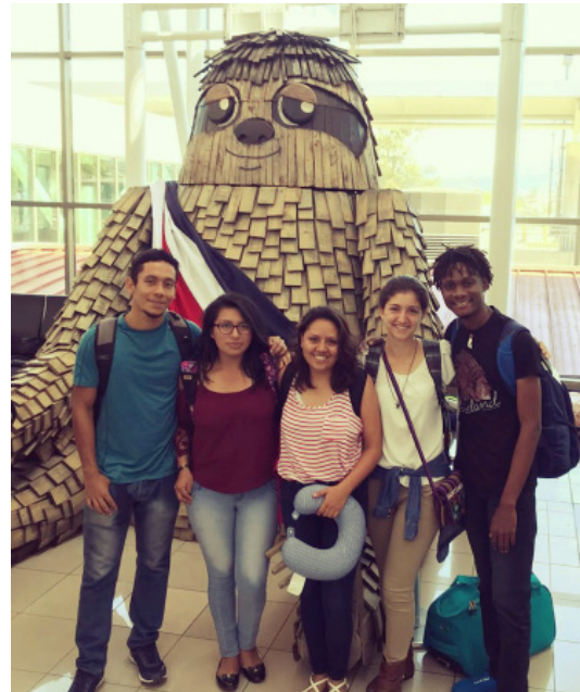
Estudiantes del PIP de la EARTH llegando a El Salvador.