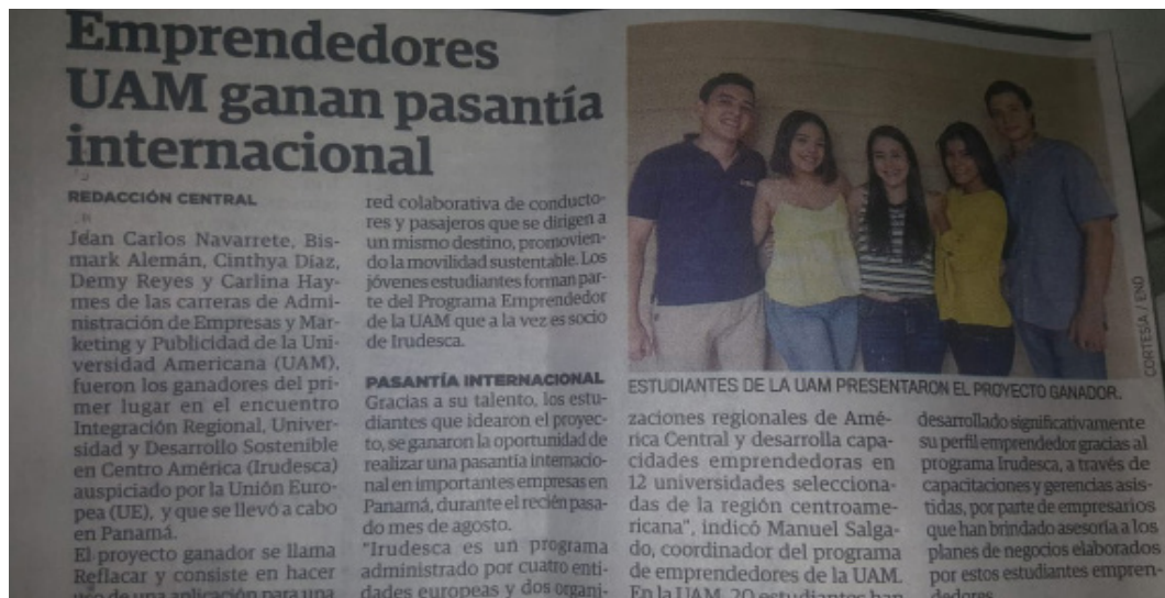
Publicación en periódico de Nicaragua, proyecto IRUDESCA.